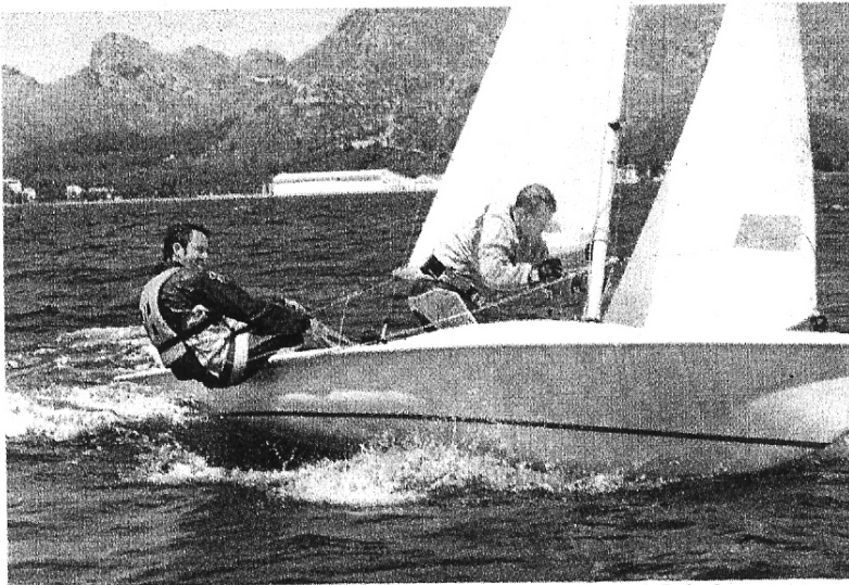
En la imagen el 'Palma Dosi000' de Joan Cabrer, vencedor en la categoría RNI-2 de la Regata Trofeo Carma.

Organizado por el RCNPP, toman parte los 200 mejores regatistas del mundo de la especialidad